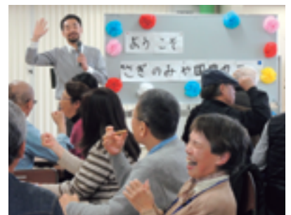
たくさんおしゃべりしましょう