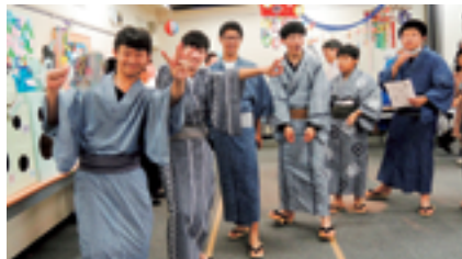
浴衣を楽しむ(昨年7月)