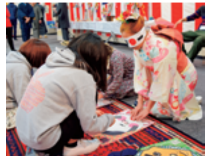
日本の伝統を体験

今年は、中野駅前南口町会のご協力により、お餅つきも行いました。昔ながらのお餅つきを体験できるとあって、それを楽しみにしてきたという方も。中野邦楽合奏団による琴・尺八の演奏を堪能した後の演奏体験も大人気。美しい音が出るまで熱心にチャレンジする外国の方が何人もいました。東亜学園高等学校、明治大学国際交流学生委員会の皆さんが、伝統遊びの会場を盛り上げてくださり、参加した外国の方もとても喜んでいました。7月14日(木)には、夕涼み会があります。どうぞお楽しみに!