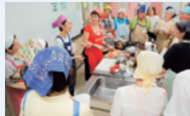
障害者福祉会館 (昨年6月)

フランス出身の方から、お母さん直伝のグラタン・デザート等の作り方を教えてもらいます。