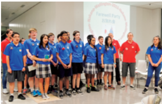
帝京平成大学でのお別れ会 (2015年10月)

2015年にホストファミリーをした家庭の中学生を主なメンバーとして、ニュージーランド・ウェリントン市へ派遣し、ホームステイしながら、学校への体験入学や環境学習、乗馬体験、施設見学などの活動を通して、語学学習と異文化理解・相互交流を図ります。