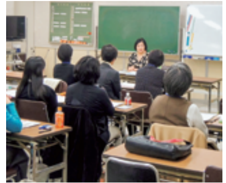
昨年度の日本語ボランティア実践講座

それぞれの国の文化や事情などについて、区民がその現状を知り理解を深める機会として開講します。