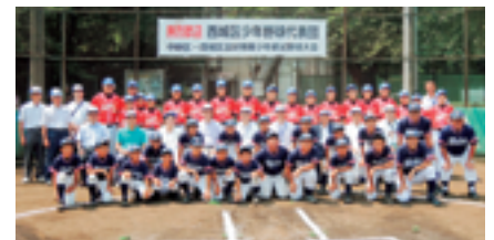
哲学堂野球場での交流試合(昨年8月)

今年は、中野区と北京市西城区が友好関係締結をして30周年にあたります。国際交流協会は区と連携して、市民レベルの交流の機会を設け、友好親善を深めます。