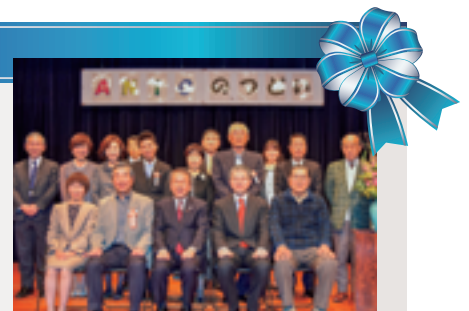
なかの芸能小劇場での表彰式