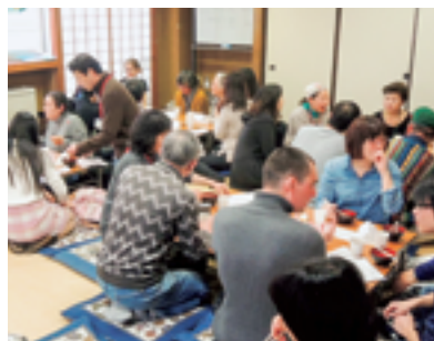
おしるこを食べながら

2月20日(土)、一足先に鍋横区民活動センターで行われたカフェでは、35名の方がおしるこを囲んで、おしゃべりに花が咲きました。3月12日(土)には、鷺宮区民活動センターでのカフェに42名の方が集まり、ひとしきりのおしゃべりの後、バンド演奏に耳を傾けました。日本語でおしゃべりしてみたい、困った時はお手伝いしたい、外国のことを知りたい…どうぞカフェに遊びにいらしてください。毎月、鍋横あるいは鷺宮で開催します。開催日はANIC ホームページでお知らせします。